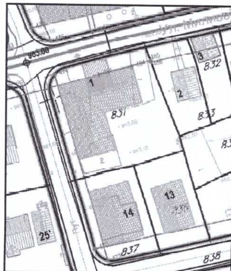
регулација и нивелација