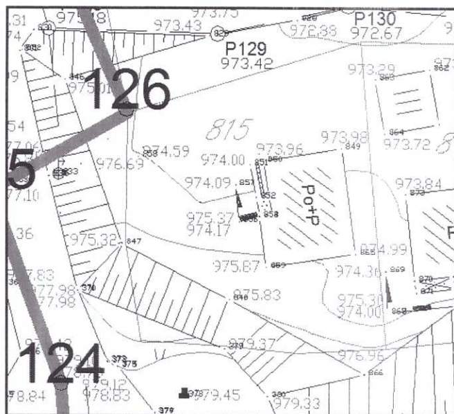
2 Геодетска подлога