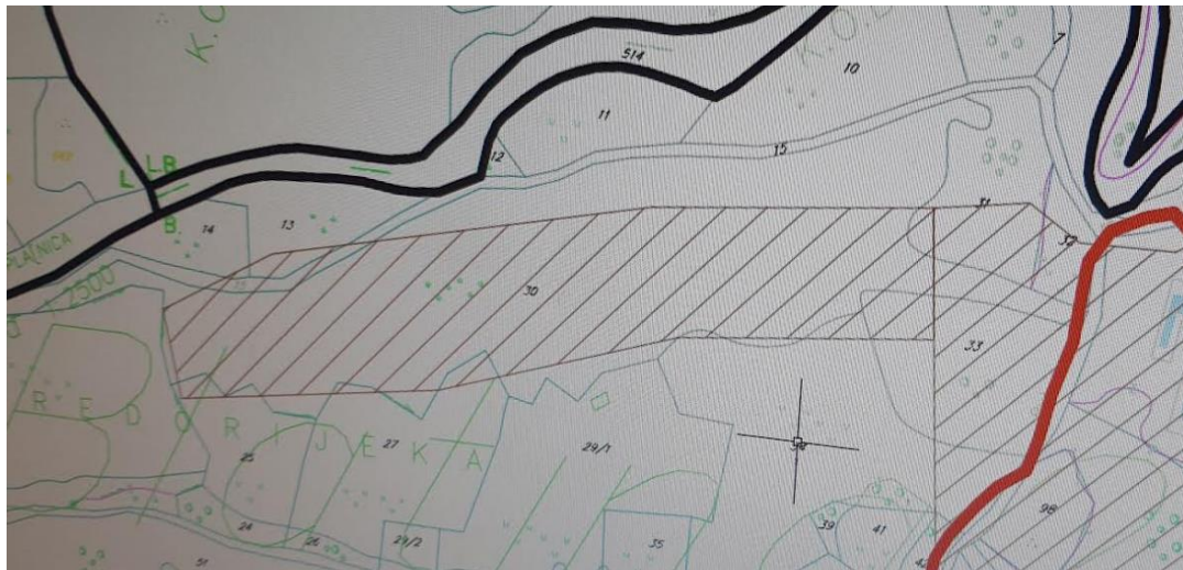
извод из ПУП-а