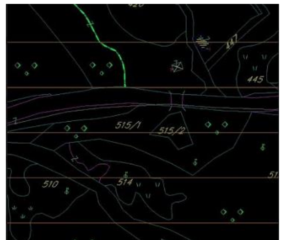
извод из ПУП-а