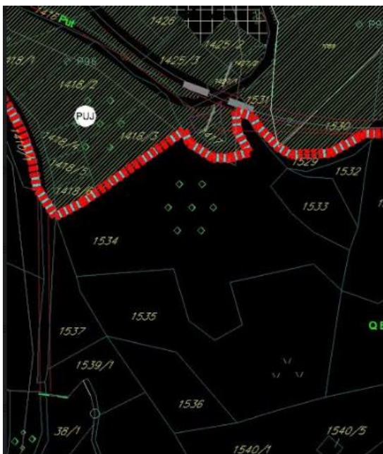
Извод из ПУП-а